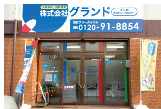
■ 上三川エントリーセンター