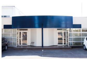
■ 宇都宮サービスステーション