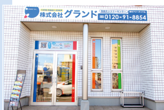
■ 太田エントリーセンター