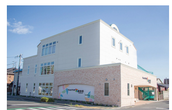
■ 高齢者介護施設 Grand F&M 四季采