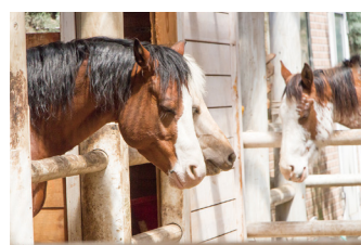
■ Grand pony club Grand pony 学童 club