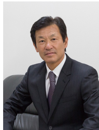
株式会社グランド 代表取締役

ものづくりと並行しサービス事業や福祉事業では、人材育成・教育に比重を置き、新たな付加価値向上の施策を積極的に進め、お客様と働く方々のご満足の為、より良いサービスの提供を目指し、日々の革新をコンセプトに皆様と共に次のステージへ向かって参ります。